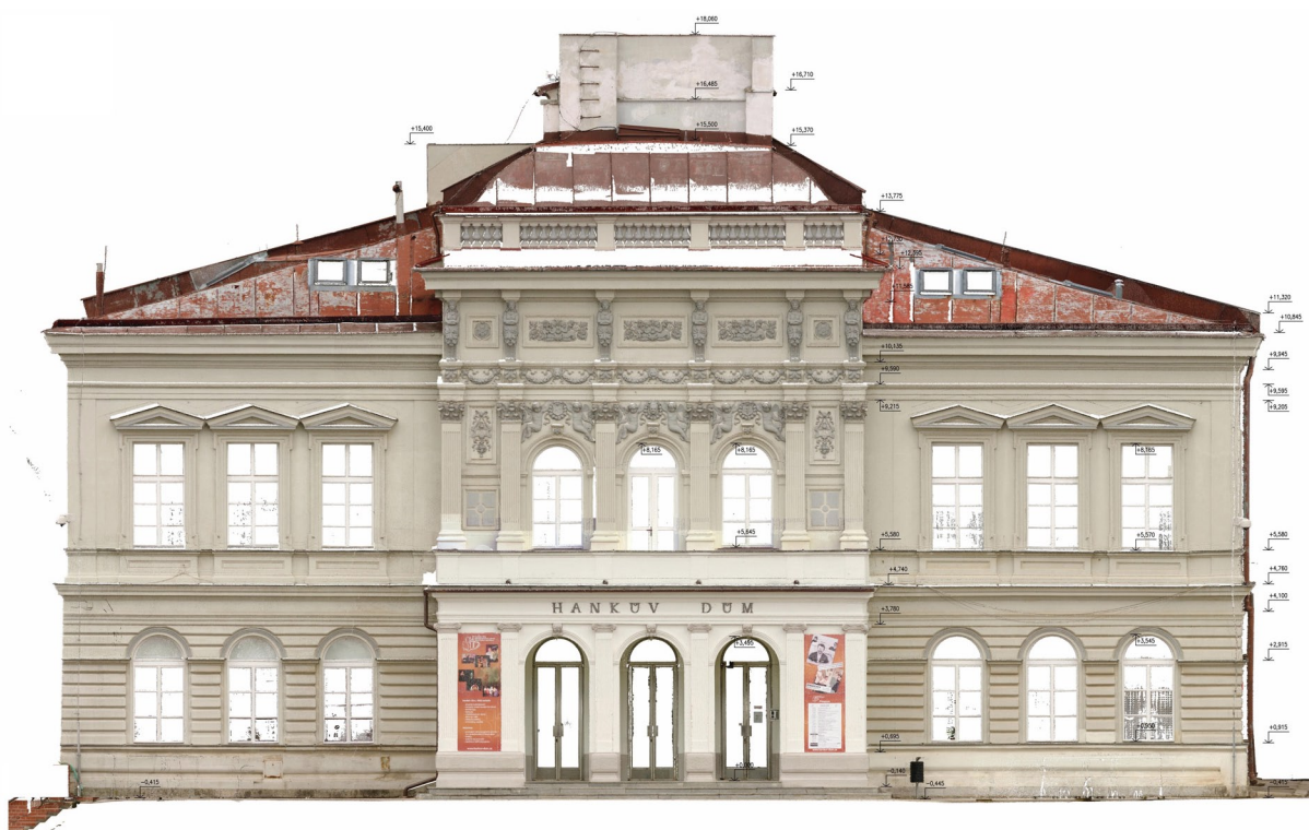
Obr. 9: Laserové zaměření jižní fasády Hankova domu, M 1:200 (Kudrnovský, 2014).