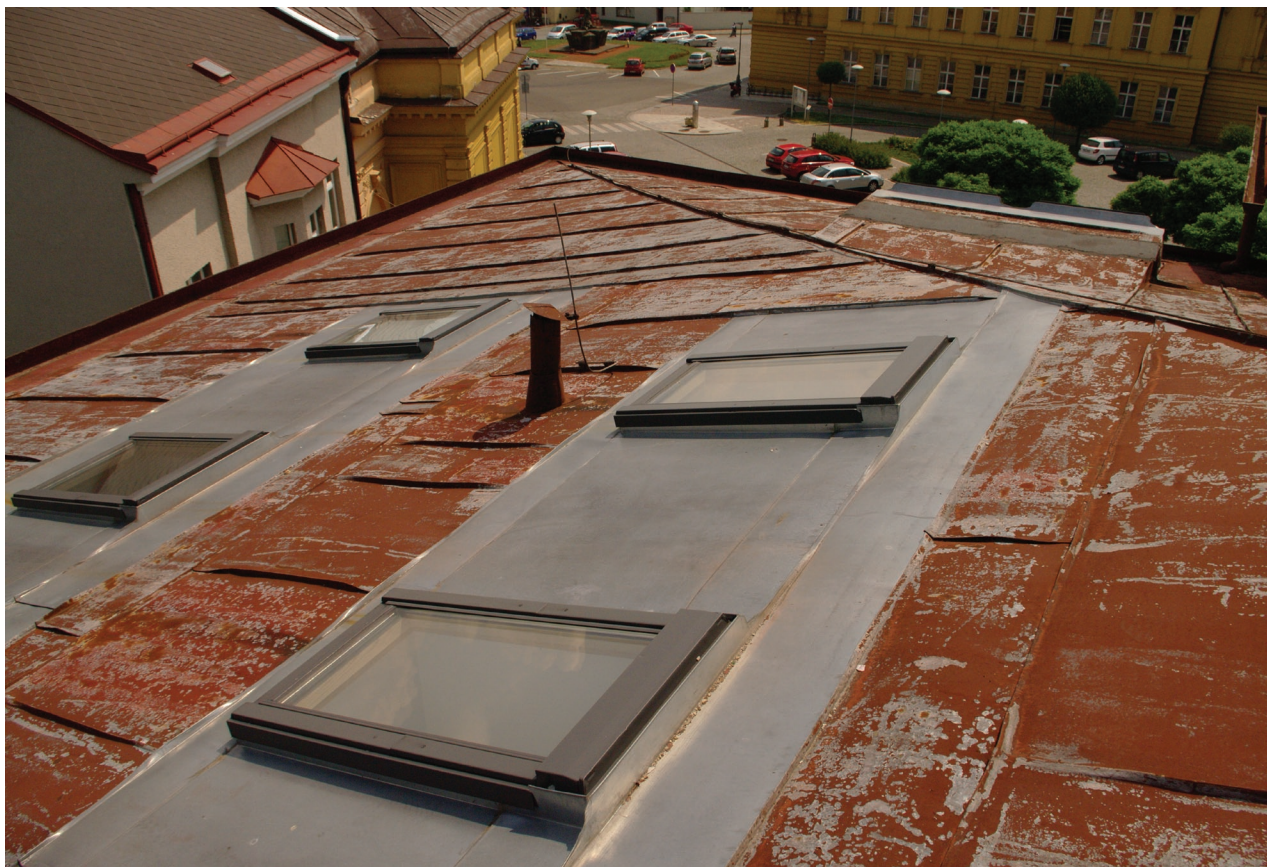
Obr. 29: Pohled na jihovýchodní nároží střechy Hankova domu (Kudrnovský, 2015).