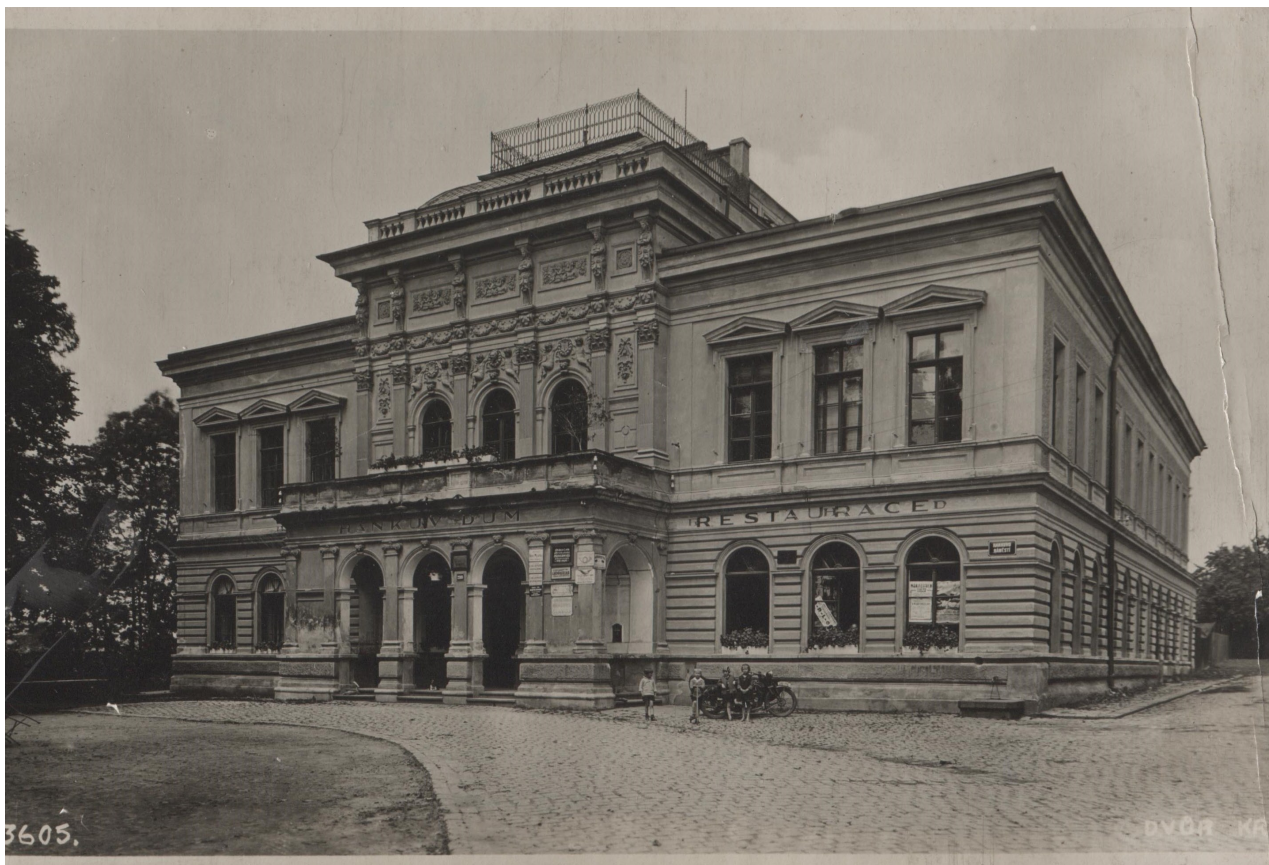
Obr. 4: Pohled na budovu Hankova divadla - bez mladších úprav (5524/99, Hankovo divadlo, Geislerova sbírka, Městské muzeum Dvůr Králové nad Labem, nedatováno).