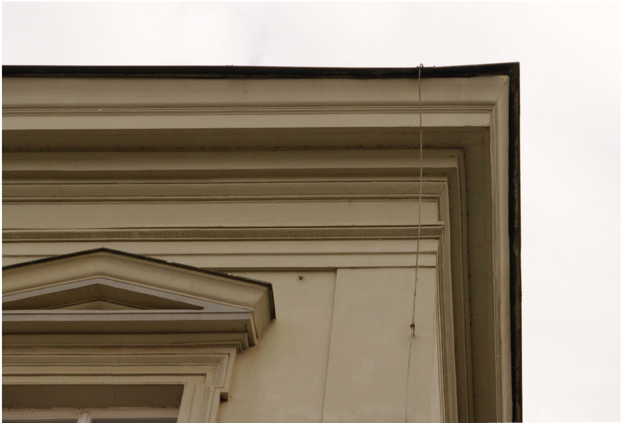
Obr. 19: Detailní pohled na korunní římsu budovy Hankova domu (Kudrnovský, 2015).