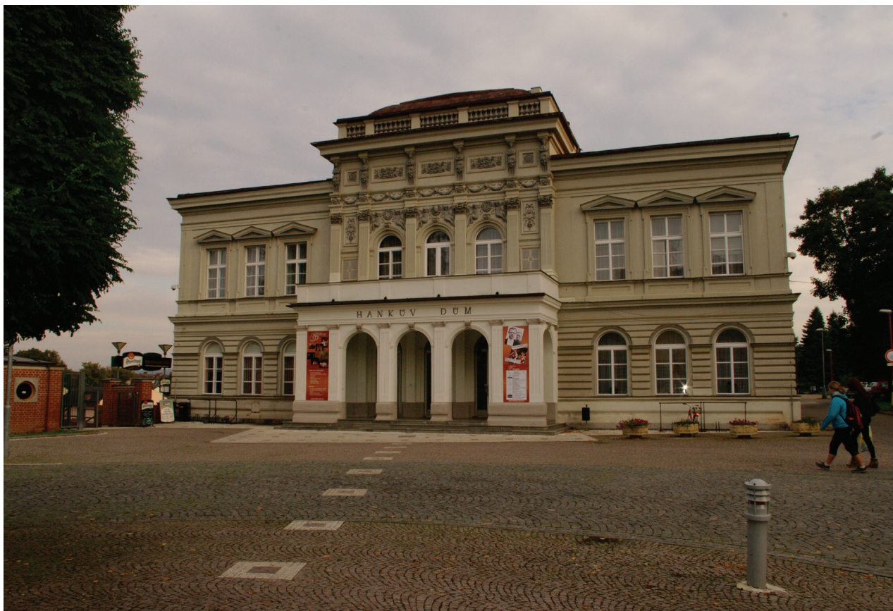
Obr. 15: Pohled na hlavní průčelí Hankova domu (Kudrnovský, 2015).