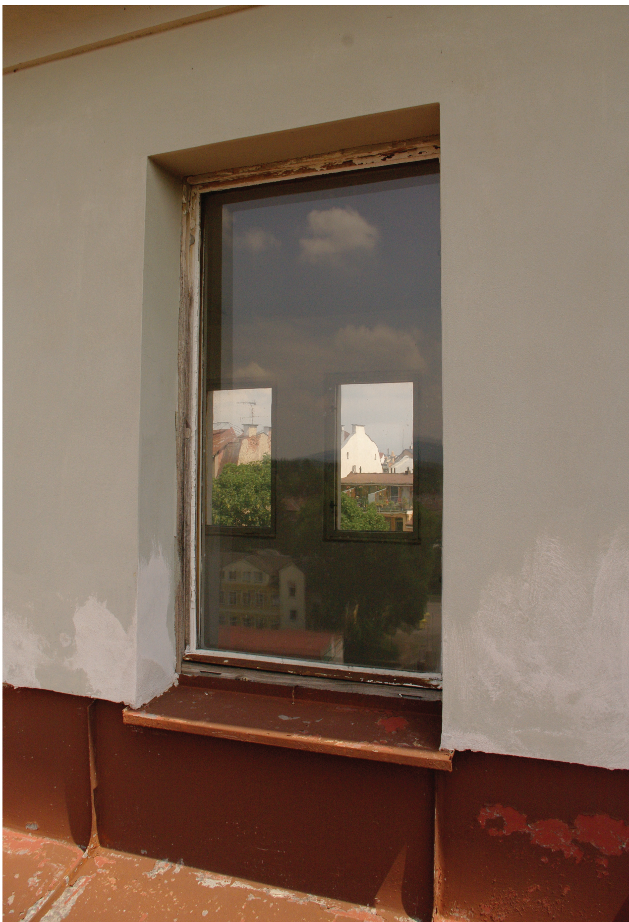
Obr. 33: Pohled na novodové nečleněné zdvojené okno střešního pavilonu (Kudrnovský, 2015).