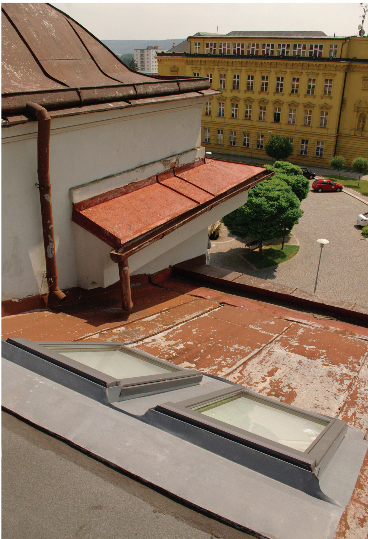
Obr. 25: Pohled na jihozápadní část střešního pláště Hankova domu (Kudrnovský, 2015).