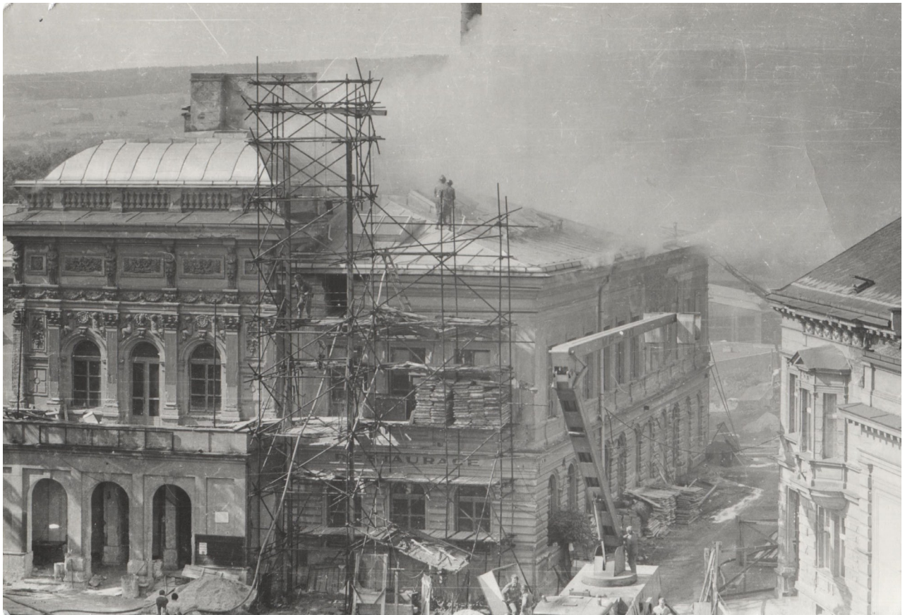
Obr. 7: Oprava Hankova divadla na přelomu 60. a 70. let (5540/99, Hankovo divadlo, Geislerova sbírka, Městské muzeum Dvůr Králové nad Labem, 1974).