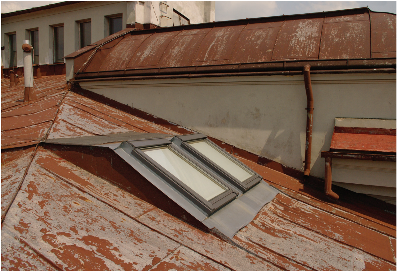
Obr. 26: Pohled na střešní okna vyzvednutá nad střešní rovinu (Kudrnovský, 2015).