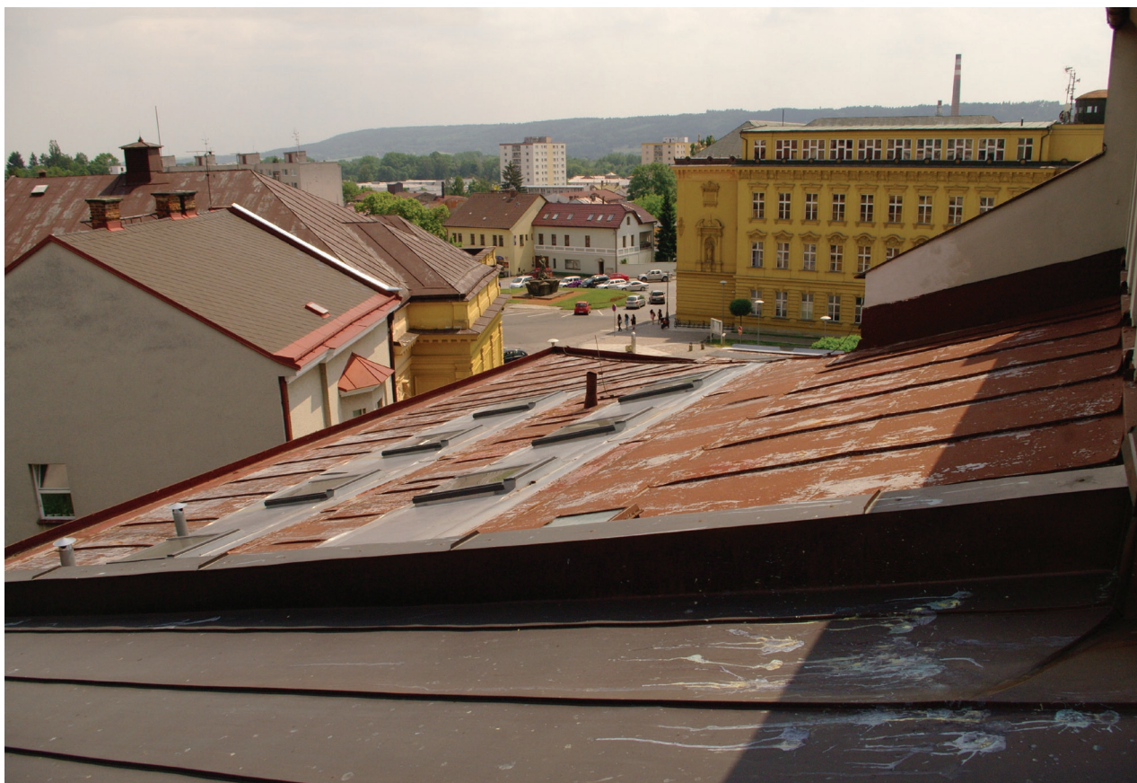
Obr. 28: Pohled na východní část střechy Hankova domu od severu (Kudrnovský, 2015).