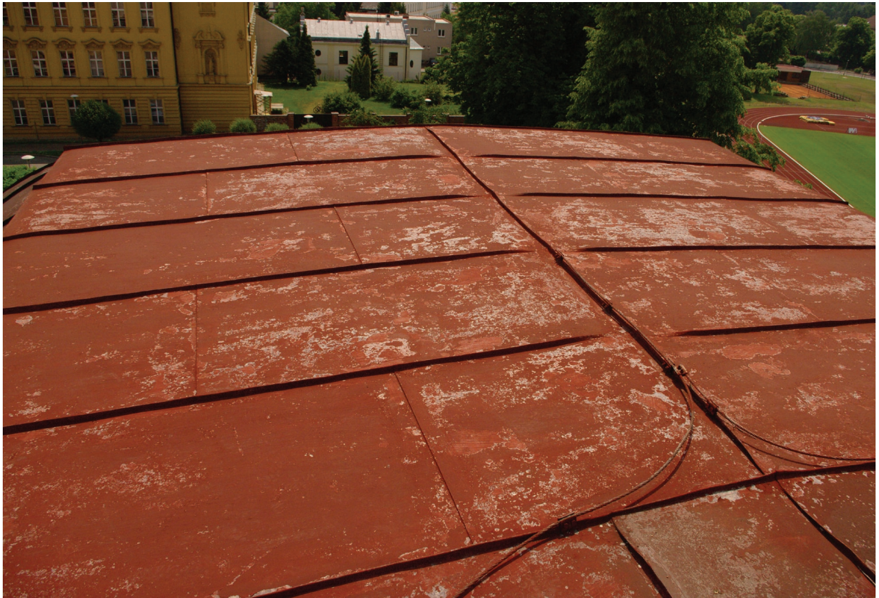
Obr. 31: Pohled na temeno báňové střechy Hankova domu (Kudrnovský, 2015).