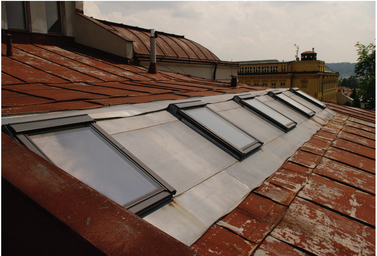
Obr. 23: Pohled na jihozápadní část střechy Hankova domu s pětící střešních oken (Kudrnovský, 2015).