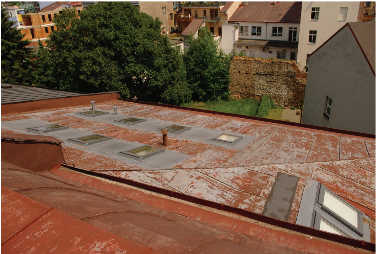
Obr. 27: Pohled na východní část střechy Hankova domu (Kudrnovský, 2015).