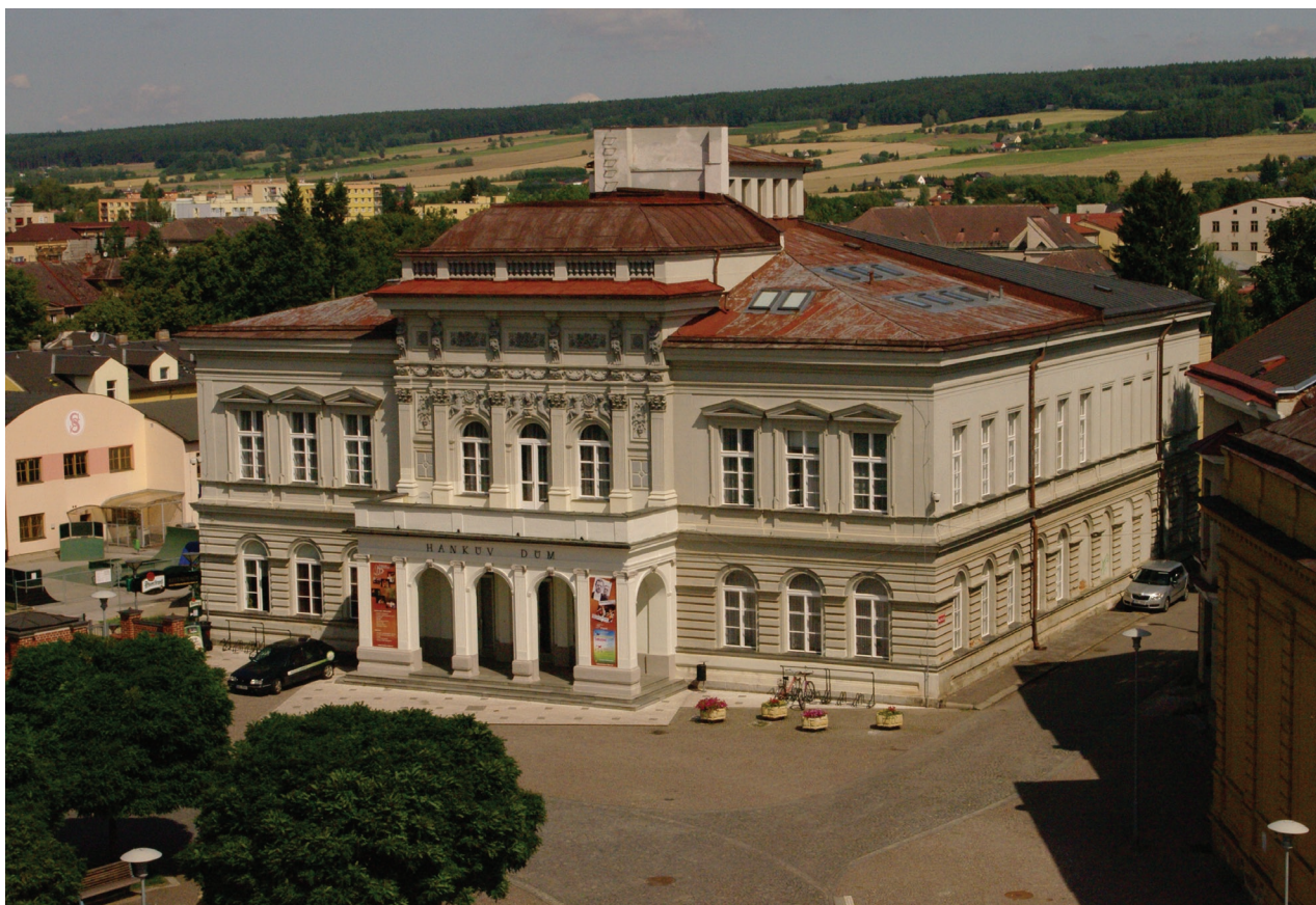
Obr. 14: Pohled na Hankův dům ze střechy gymnázia (Kudrnovský, 2015).