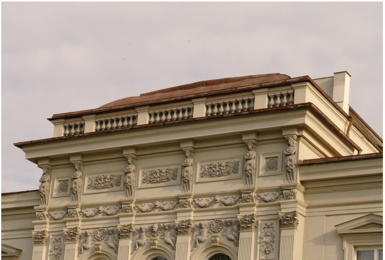
Obr. 18: Pohled na horní část středního dílu hlavní fasády Hankova domu (Kudrnovský, 2015).