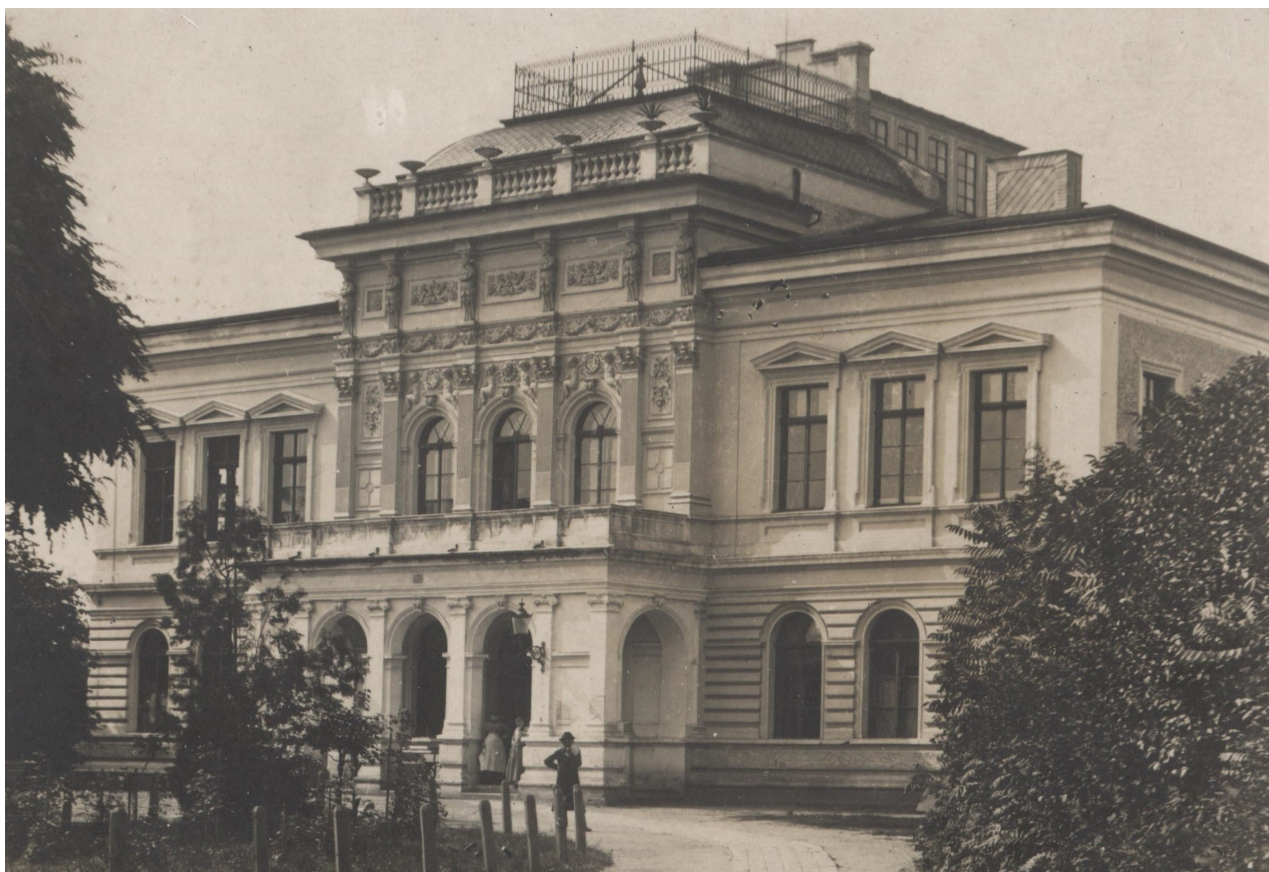
Obr. 3: Pohled na budovu Hankova divadla - bez pozdějších úprav (F665/a, Hankovo divadlo, fotosbírka, Městské muzeum Dvůr Králové nad Labem, nedatováno).