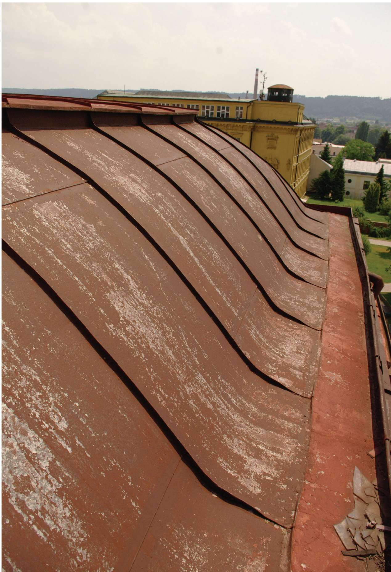
Obr. 30: Pohled na křivku stěny báňové střechy Hankova domu (Kudrnovský, 2015).