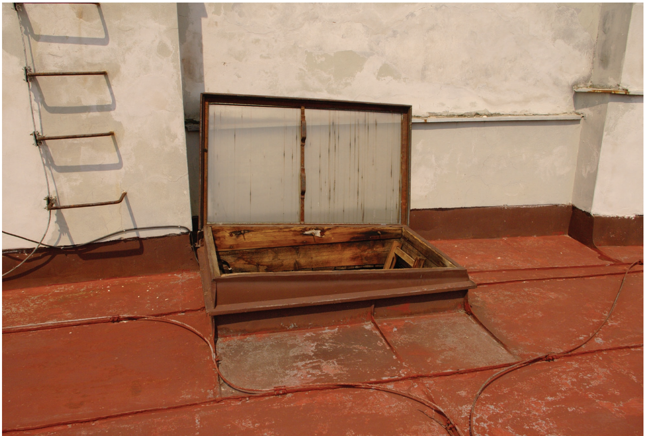
Obr. 32: Střešní výlez situovaný na temeni báňové střechy (Kudrnovský, 2015).