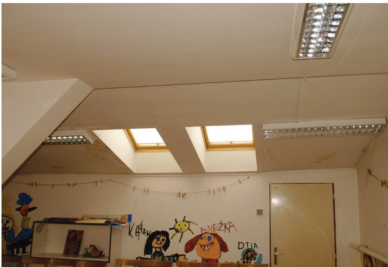
Obr. 36: Podkroví se střešními okny ústícími do hlavního průčelí (Kudrnovský, 2015).