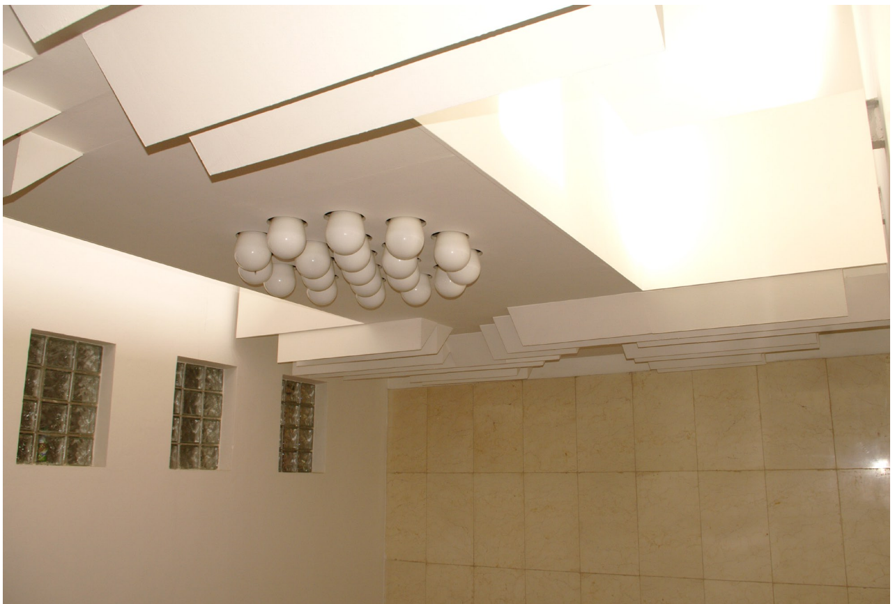
Obr. 35: Schodiště osvětlované okny střešního pavilonu (Kudrnovský, 2015).