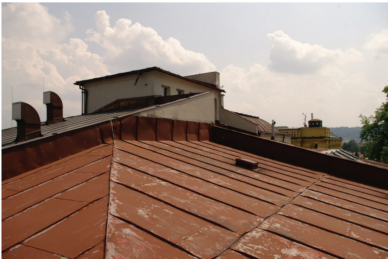
Obr. 21: Pohled na střešní pavilon od severozápadu (Kudrnovský, 2015).