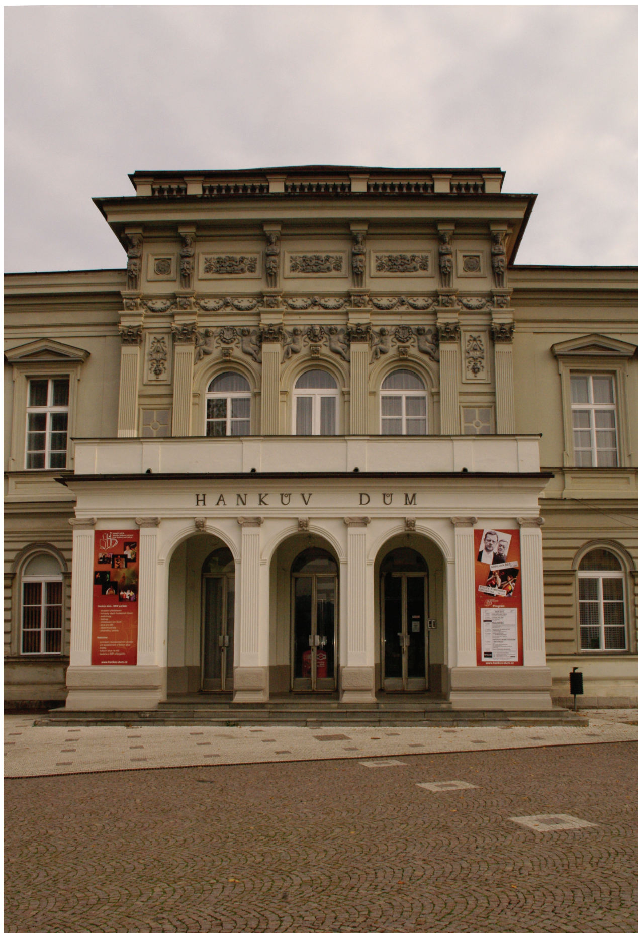
Obr. 16: Pohled na střední díl hlavního průčelí Hankova domu (Kudrnovský, 2015).