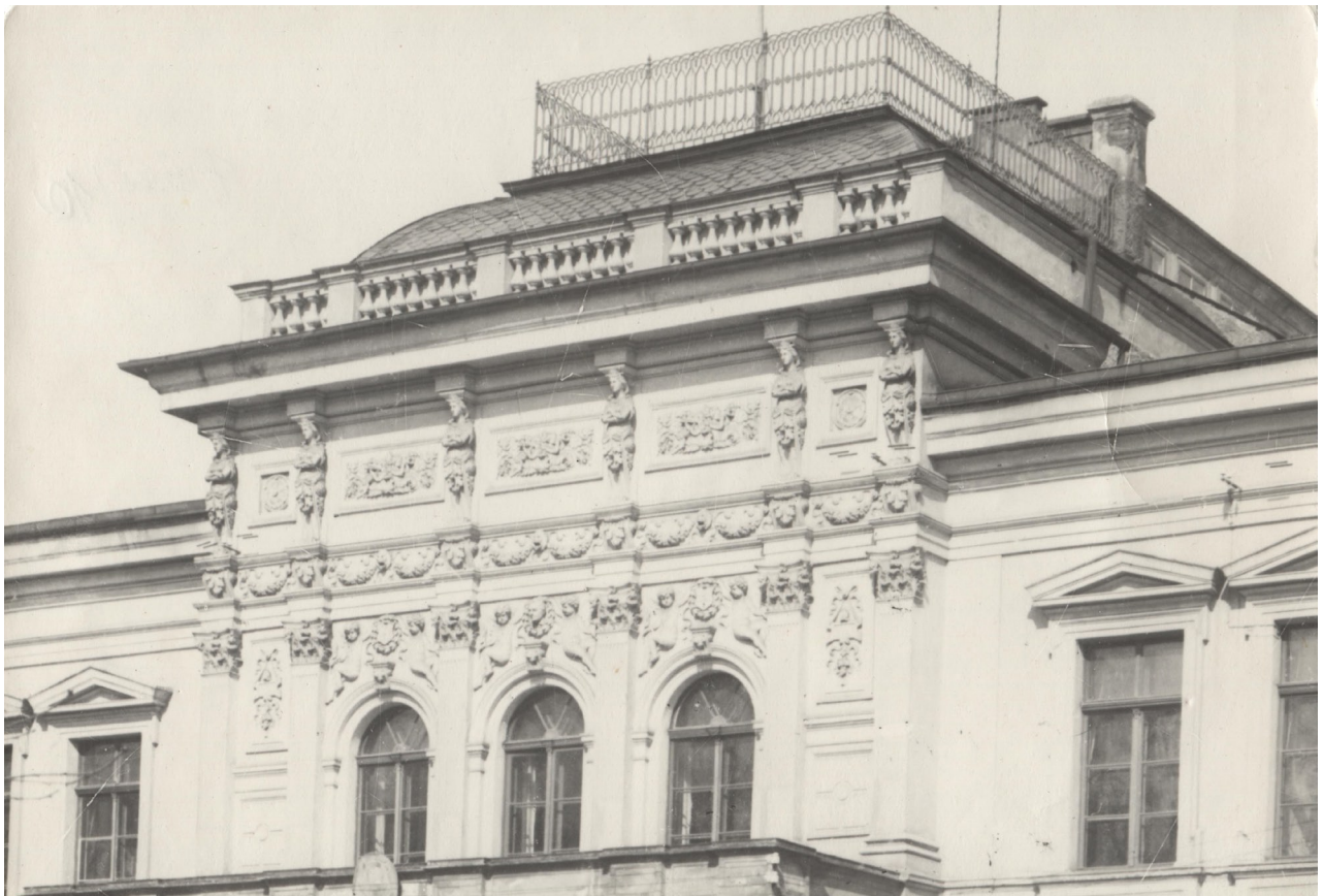
Obr. 6: Detailní pohled na budovu Hankova divadla (F665/10, Hankovo divadlo, fotosbírka, Městské muzeum Dvůr Králové nad Labem, nedatováno).