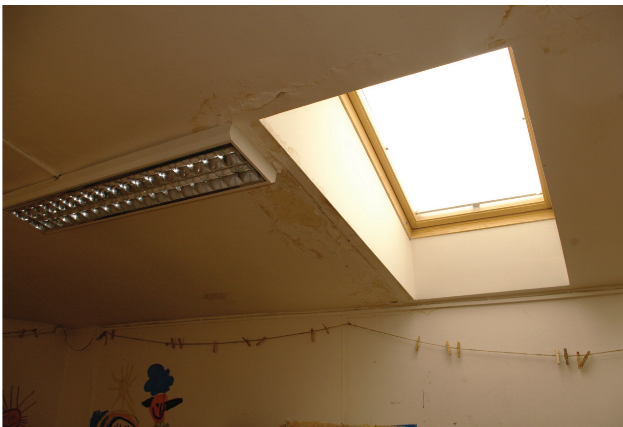
Obr. 37: Zatékání do podkroví způsobené zmenšením sklonu střechy nad střešním oknem (Kudrnovský, 2015).