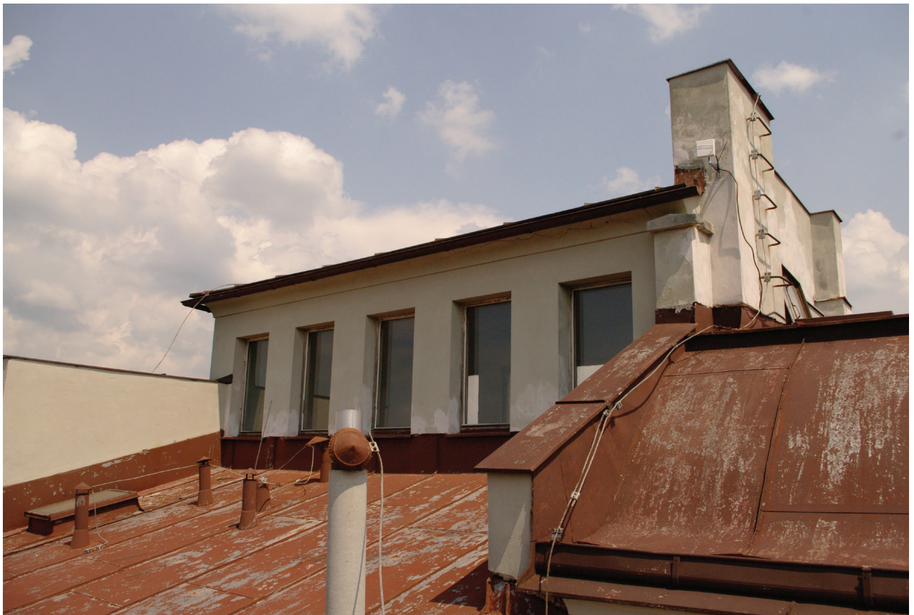
Obr. 20: Pohled na střešní pavilon od jihozápadu (Kudrnovský, 2015).