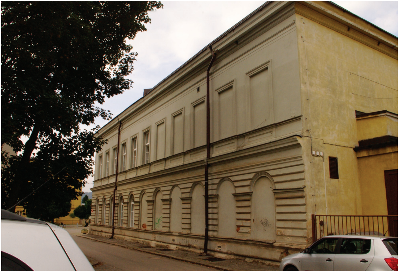
Obr. 17: Pohled na východní průčelí Hankova domu (Kudrnovský, 2015).