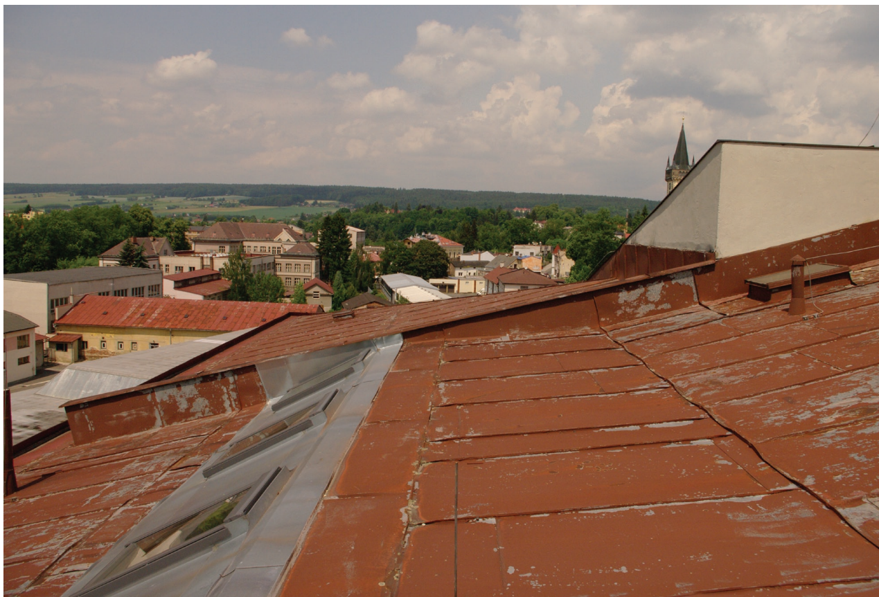
Obr. 22: Pohled na severozápadní část střechy Hankova domu (Kudrnovský, 2015).