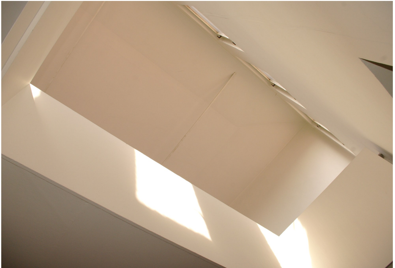
Obr. 34: Pohled do střešního pavilonu, jenž osvětluje schodiště (Kudrnovský, 2015).