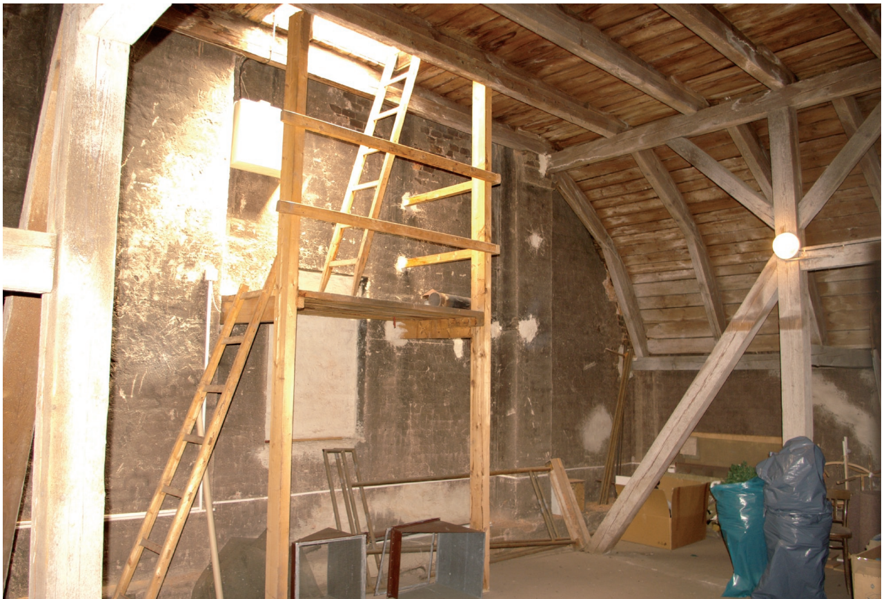
Obr. 39: Pohled na konstrukci krovu báňové střechy se střešním výlezem (Kudrnovský, 2015).