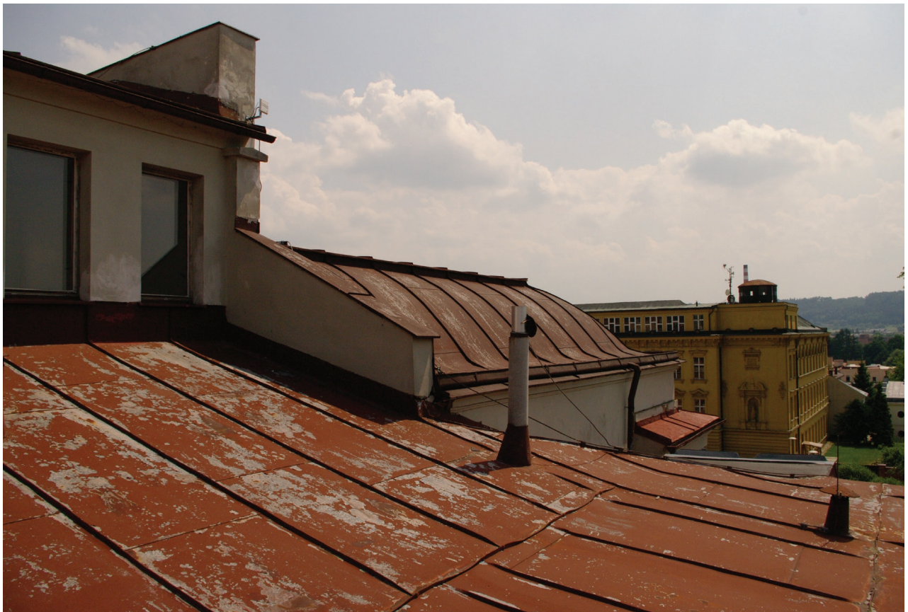
Obr. 24: Pohled na jihozápadní část valbové střechy a báňovou střechu Hankova domu (Kudrnovský, 2015).