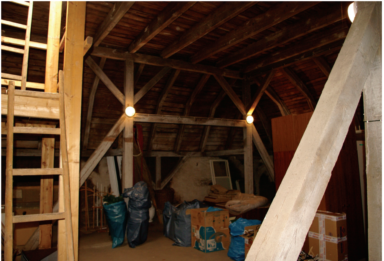
Obr. 38: Pohled na konstrukci krovu báňové střechy (Kudrnovský, 2015).