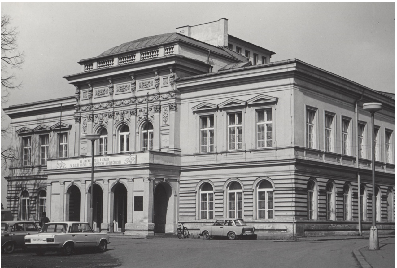
Obr. 8: Opravené Hankovo divadlo (F665 56/7, Hankovo divadlo, fotosbírka, Městské muzeum Dvůr Králové nad Labem, nedatováno).