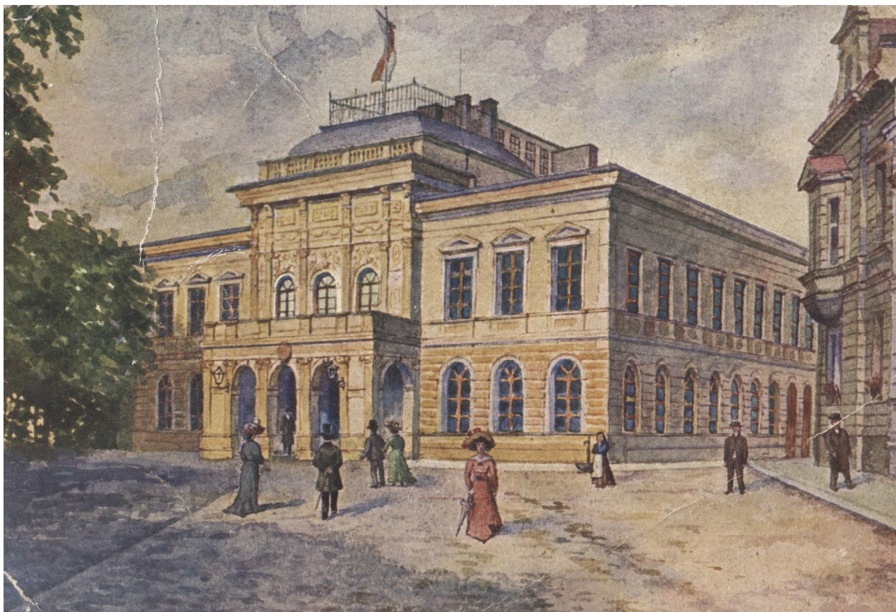
Obr. 2: Kolorovaná pohlednice Hankova divadla (5528/99, Hankovo divadlo, Geislerova sbírka, Městské muzeum Dvůr Králové nad Labem, nedatováno).