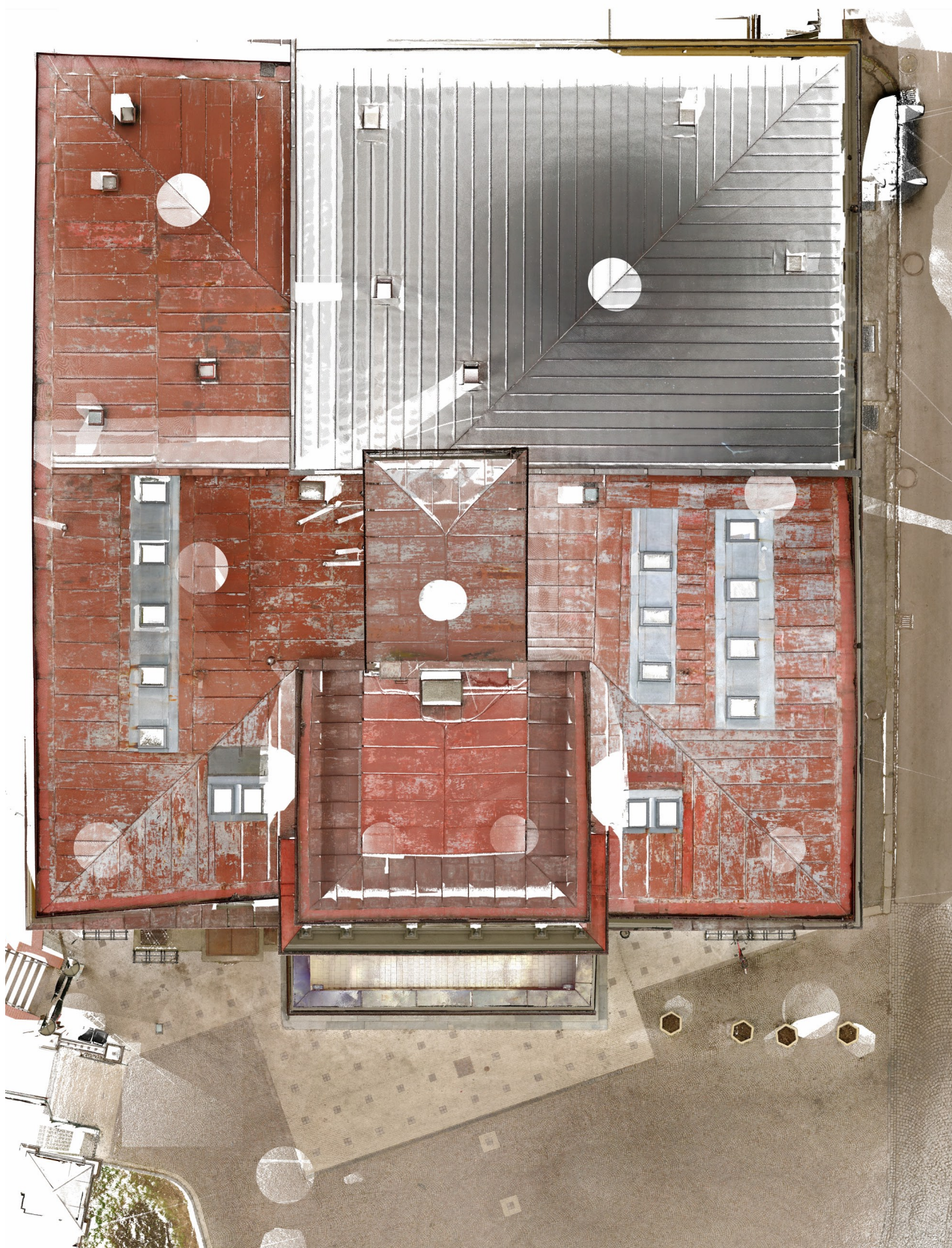
Obr. 13: Laserové zaměření střešního pláště Hankova domu, M 1:200 (Kudrnovský, 2014).