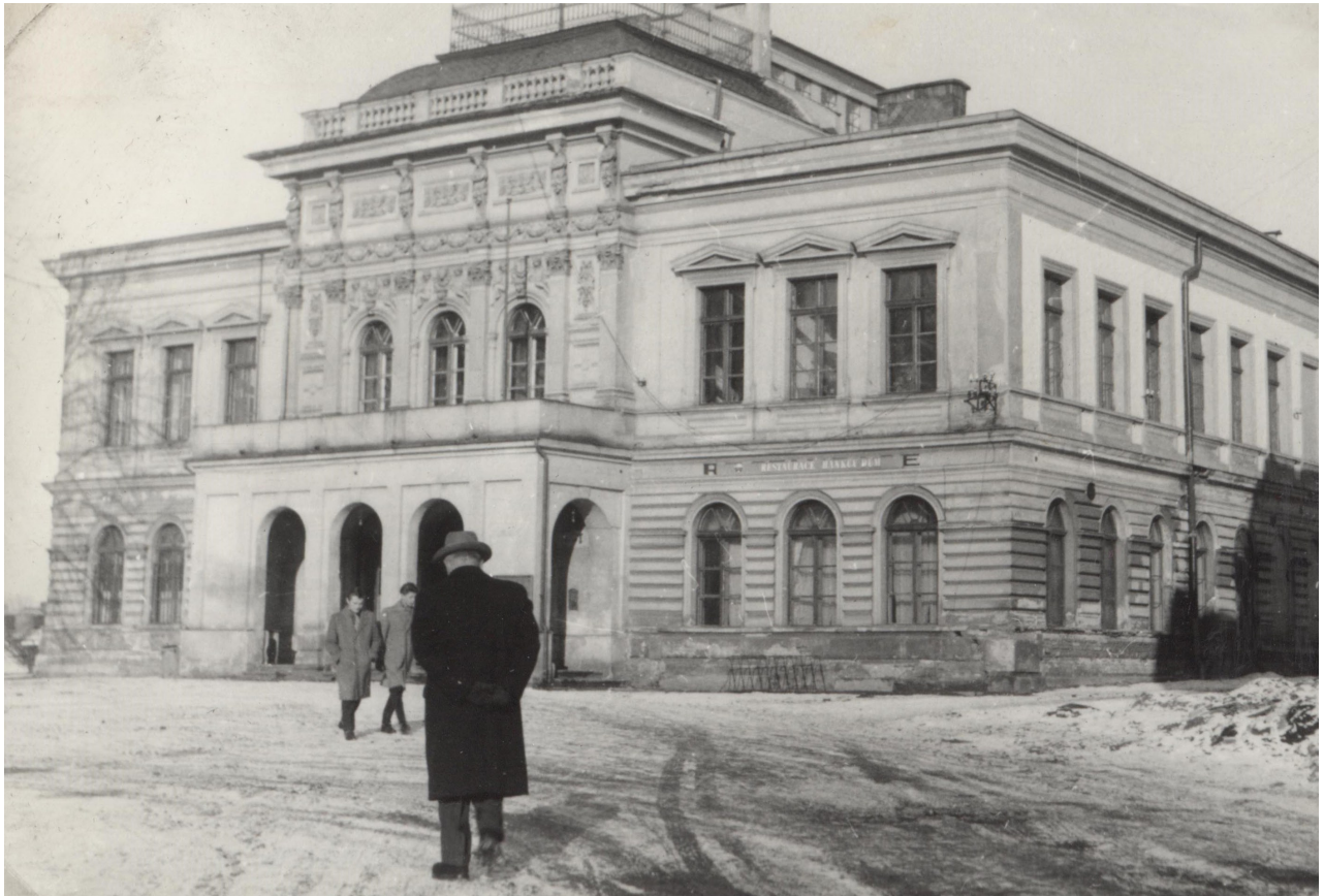
Obr. 5: Pohled na budovu Hankova divadla po obnově vstupního portiku (116-D-98 Hankovo divadlo, nedatováno).