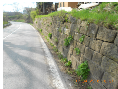
STÁVAJÍCÍ BOURANÁ OPĚRNÁ ZEĎ - KAMENNÁ