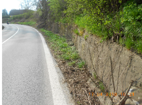
STÁVAJÍCÍ OPĚRNÁ ZEĎ PONECHANÁ - BETONOVÁ