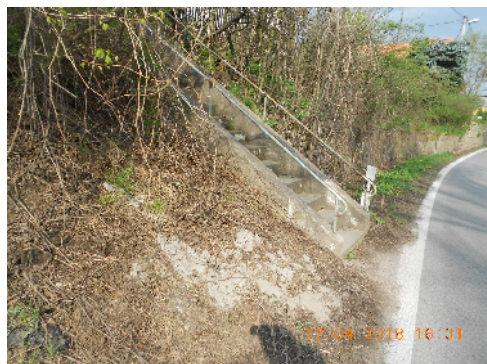
STÁVAJÍCÍ BOURANÉ SCHODIŠTĚ